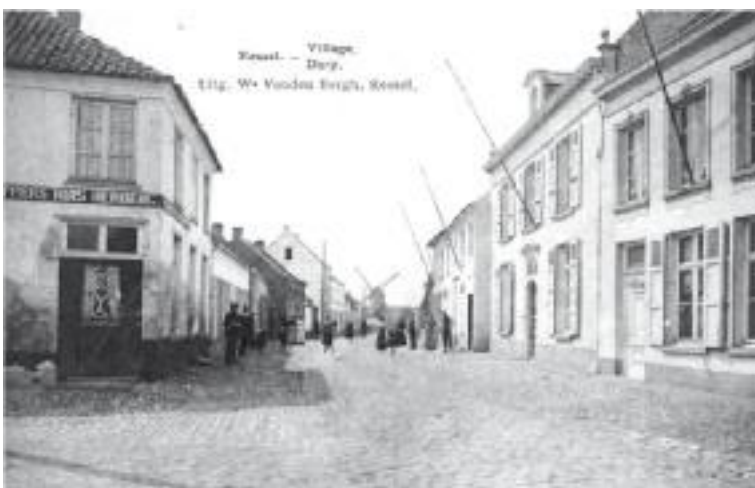
Foto boven: postkaart begin 20ste eeuw, met het Schippershuis en achteraan de molen