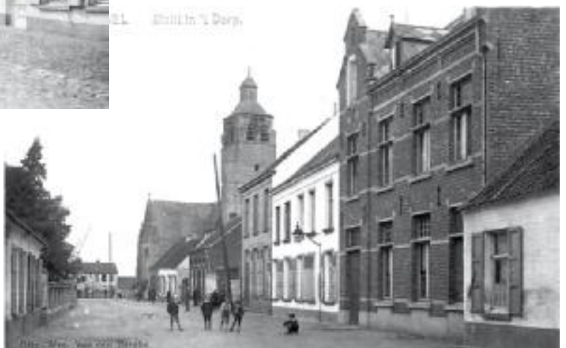
Foto onder: door het oorlogsgeweld van oktober 1914 verdween onder andere het Schippershuis